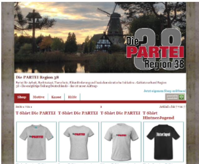
Shop der PARTEI Region 38 [2]

Es muss nicht immer der graue Polyesteranzug von C&A für €59,- sein. Wenn Sie gut gekleidet sein wollen, können Sie sich auch in unserem Webshop [2] mit T-Shirts u.ä. eindecken. Damit können Sie hoch erhobenen Hauptes durch die Stadt gehen, ohne dumm angeguckt zu werden. Versuchen Sie das einmal mit einem T-Shirt der FDP. Stöbern Sie auch ruhig in den Shops der Parteifreunde aus Berlin [3], Dortmund [4] und Frankfurt [5].